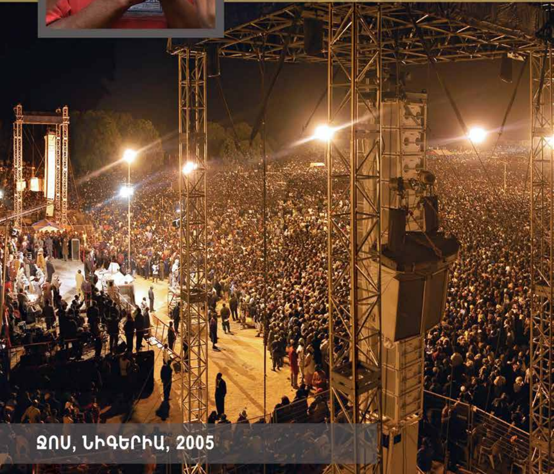
ԶՈՍ, ՆԻԳԵՐԻԱ, 2005