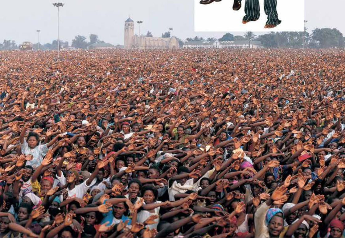
ԱԿԵՏԱՐԱՆԻ ՀԱՄԱՐ ՄԵՇ ԶԱՐՑ ՈՒՆԵՑՈՂ ՄԱՐԴԻԿ, ՄԲՈՒԶԻ-ՄԱՅԻ, 1991